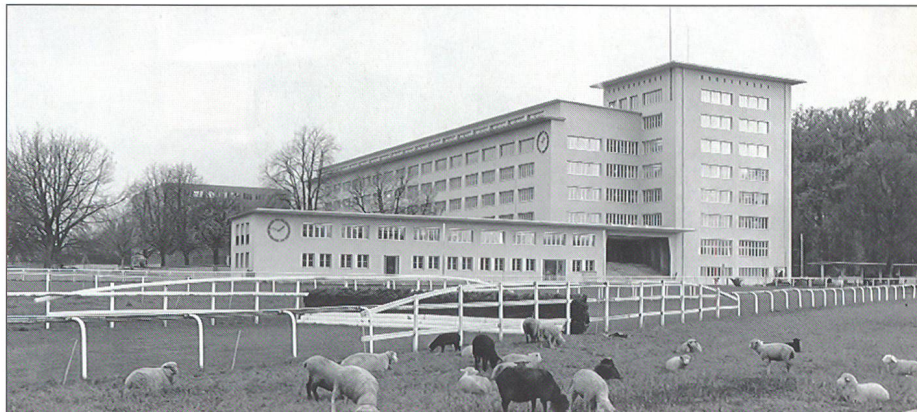
Die ehemalige Kaserne der Inf RS Luzern, im Hintergrund der Neubau.

Für den FLG II setzte ich mir das Ziel, den Führungsrhythmus zu «beherrschen» und «fähig zu sein», einen Stab effizient und zielgerichtet einsetzen zu können.