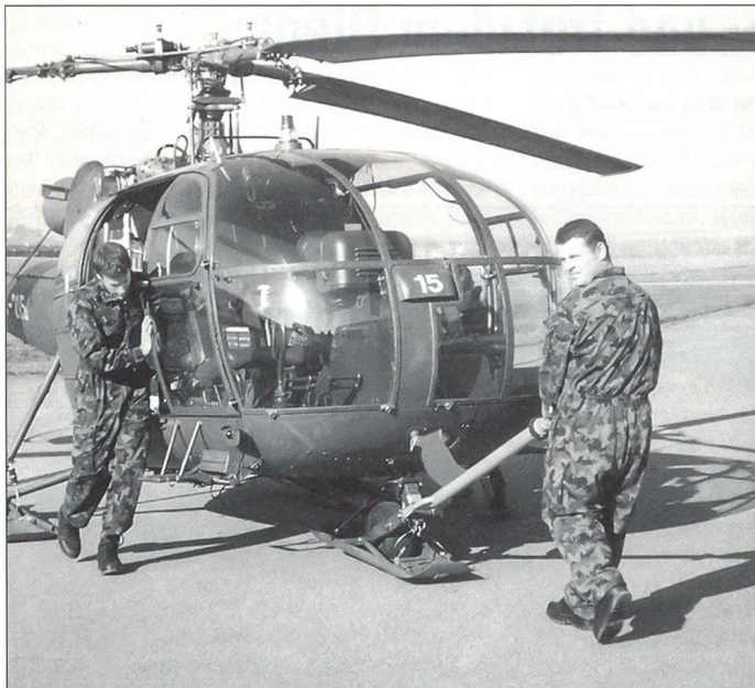
Eine Alouette 3 wird auf die Platte gezogen. Dadurch kann der Helikopter mit Muskelkraft verschoben werden.

erst lehrten sie uns die allgemeine Flugzeugkenntnis und auch die Kabinenkennntnis, damit man später bei den Wartungsarbeiten wusste, welcher Knopf überhaupt gemeint war, den man laut Vorschrift drücken musste. Später lernten wir die Helis retablieren, Flugbereitschaft erstellen