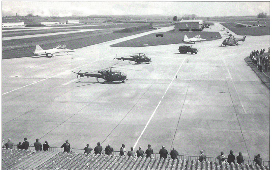
Am Besuchstag wird die gelernte Arbeit mit Stolz gezeigt.

Es ist ein schöner Tag. Flugwetter! Ich nehme das Logbuch der Alouette 3 zur Hand, unterschreibe und stelle die zwei Helikopterwarte in Achtung. Jetzt kommt die Meldung an den wartenden Piloten: «Melde Helikopter V-2 15 flugbereit, betankt mit 300 l, Stollen montiert, Abdeckungen entfernt.» Der Pilot steigt ein, die Warte und ich stellen uns vor dem Helikopter auf. Der Wart 1 gibt das O.K. und der Pilot lässt die Maschinen starten, während der Wart 2 mit dem Feuerlöscher das Ganze überwacht. Nun hebt die Alouette ab, um ihre Mission zu erfüllen, und wir bleiben zurück, um sie am Abend wieder in Empfang zu nehmen und zu reetablieren.