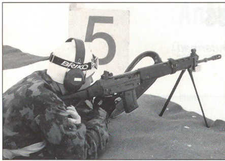
Biathlon Realp: Jeder Schuss zählt. Pro Fehlschuss musste jeweils eine 150-m-Strafrunde absolviert werden. Da lohnte es sich, sorgfältig zu zielen. Die Wahl der Scheiben stand den Schützen offen.

Sie sollte die etwa 6 Kilometer lange Strecke mit einer durchschnittlichen Steigung von 170 Meter in 23 Minuten und 53 Sekunden bewältigen, was ihr erneut eine Goldmedaille einbrachte.