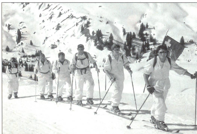
Patrouille im Aufstieg

Der Zweitage-Gebirgsskilauf wird von der ganzen Talschaft des oberen Simmentals mitgetragen. Neben zirka 250 Funktionären waren die Gemeindepräsidenten und Behördemitglieder der Ortschaften Boltigen, Zweisimmen, St. Stefan und Lenk während der ganzen Dauer des Anlasses präsent, am Sonntagmorgen auf der Metsch gar selber mit Ski ausgerüstet. Auf über 2000 Meter Höhe spornten sie die Wettkampfpatrouillen persönlich an, unterhielten sich in kameradschaftlichem Geiste mit den Sportlern, während diese nach dem Aufstieg die durchgeschwitzten Leibchen gegen trockene wechselten und waren dazu für das leibliche Wohl ihrer Gäste besorgt. Wer ins Obersimmental kommt, ob über dieses Wochenende als Wett-