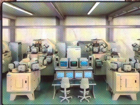
Projekt TOS SINTRO, SE