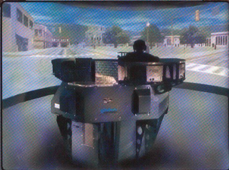
Projekt CCS KONGSBERG, SINTRO