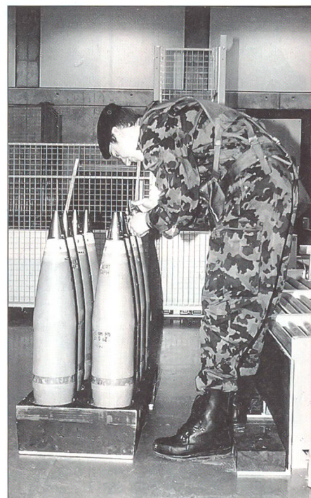
Im Schiesssimulator beim Temperieren der Art Granaten.