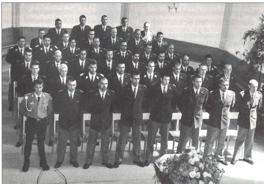
Die Diplomanden des Grundausbildungslehrganges 2000/01 kurz vor der Beförderung zum Adjutant-Unteroffizier.

Die Schweiz hat das Glück, ein bewährtes