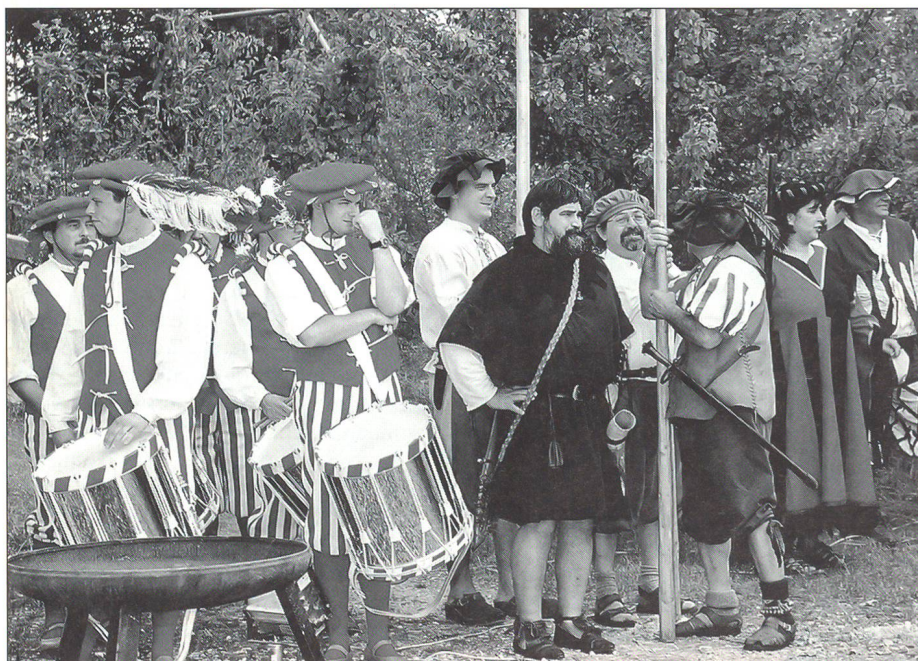
Spielleute aus dem zürcherischen Elgg mit deutschen Komparsen.

In Schwaderloh mit von der Partie waren am 14. Juli 2001 Trommler und Pfeifer aus dem zürcherischen Elgg, deutsche Landsknechte aus Bermatingen (die sogar ein imposantes Zeltlager aufgebaut hatten), der Konstanzer Fanfarenzug «Niederburg» samt FahnenSchwingern, Marketenderinnen, vielerlei Spielleute und sogar ein Feuerschlucker. Alles in allem ein malerischer