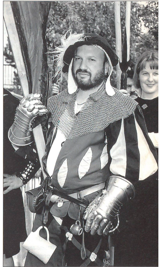
Bis ins Detail originalgetreu – Ein «Wilder Geselle» der Bermatinger Landsknechte.