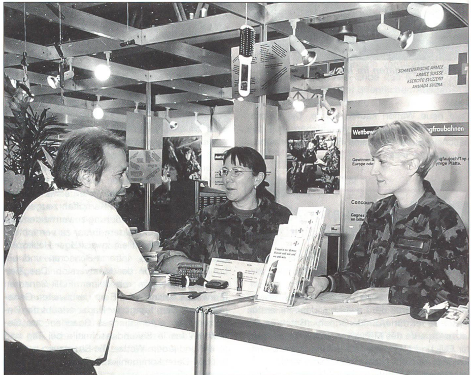
Auch Männer lassen sich über den Einsatz der Frauen in der Armee informieren.