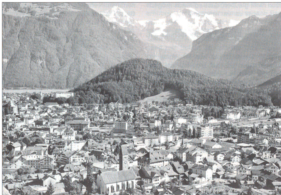
Der Tagungsort: Interlaken mit Blick zur Jungfrau.