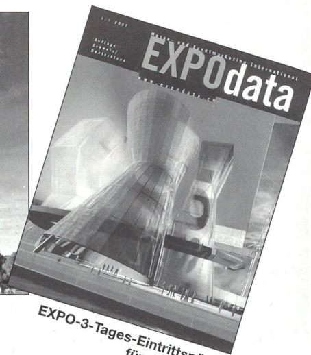
EXPO-3-Tages-Eintrittspässe für 2 Personen