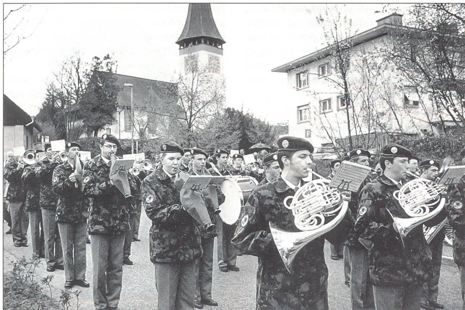
Spiel in Marschmusikformation (Klarinetten mit Regenschutz)

Dennoch sind es gerade die internationalen Einsätze, welche am meisten Beachtung fanden. Für solche Anlässe kommen primär die Eliteorchester des Schweizer Armeespiels zum Zug, vorab das Repräsentationsorchester des Schweizer Armeespiels. Mit den 1999 eingeführten roten Gala-Uniformen setzt diese Formation ihren Siegeszug als sympathischer Botschafter für unser Land an den renommierten europäischen Militärmusikfestivals fort. Nachdem Russland und Skandina-