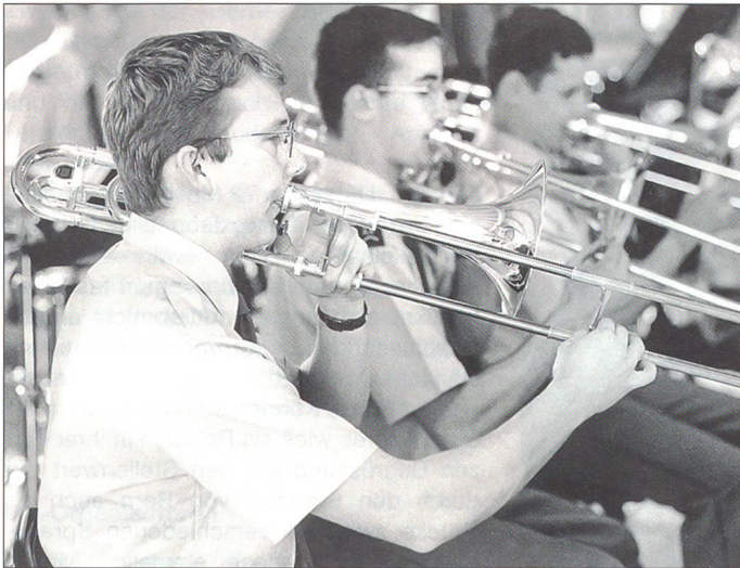
3 Posaunisten bei voller Konzentration

tat einer Militärdienstleistung in einem besonderen Umfeld Freude für andere bringen kann.