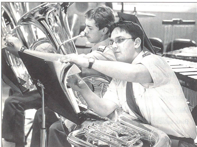
Registerprobe der Bassisten