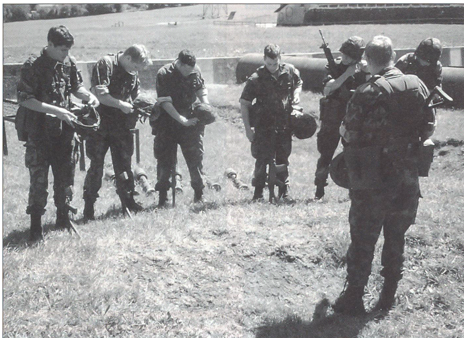
Durchdiener RS St-Maurice, Bereitstellen der Gruppe zur Übungsbesprechung.