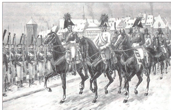
13. Januar 1814 – Zar Alexander I. von Russland, Kaiser Franz I. von Österreich und König Friedrich Wilhelm III. von Preussen in Basel. Die Parade-front bildet russische Infanterie. Abbildung aus: Jauslin.

Die Schlacht bei Dresden vom 26./27. August erlebte Stürler in der «arrière-garde». Ebenso diejenige bei Leipzig (16.–19. Oktober), in deren Folge die geschlagenen Streitkräfte Napoleons den Rückzug Richtung Rhein antraten. Stürlers Regiment gehörte zur Garde-Infanterie-Brigade, und diese unterstand dem Reservekorps der Böhmisches Hauptarmee (rund 230 000