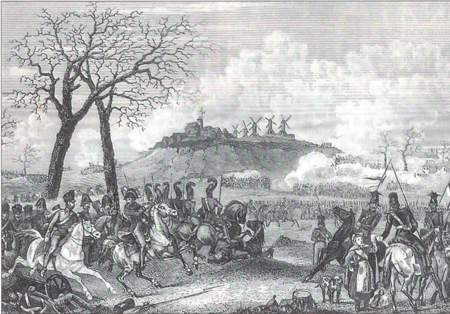
Blick auf das Schlachtfeld am Montmartre vom 30. März 1814. Abbildung aus: Sporschil.

ten bedeutenden Schlacht auf deutschem Boden; sie endete mit einem geordneten Rückzug der Alliierten.