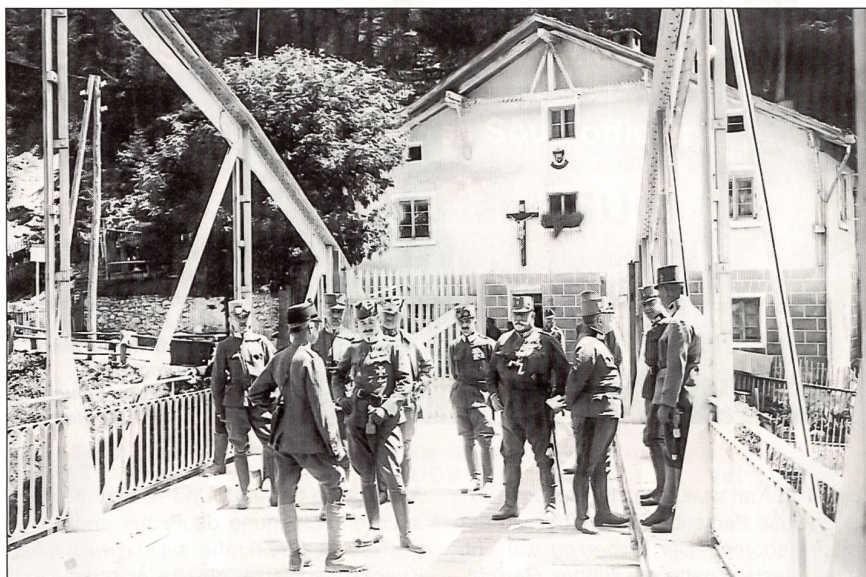
Das denkwürdige Treffen mit Kaiser Karl und seinen Stabsoffizieren bei Martinsbruck. Im Hintergrund das heute nicht mehr existierende österreichische Zollgebäude.

Gemäss der «Ordre de bataille auf 1. April 1918» (Eidg. Militärbibliothek Bern) bildete das vier Kompanien starke Bündner Geb Inf Bat 93 (Auszug) Teil des Geb Inf Rgts 36 (Geb Inf Brig 18 bzw. 6. Div). Das Bataillon hatte seit 1914 wiederholt Aktivdienst geleistet, so auch vom 20. März bis zum 16. Juni 1917 und dann erneut ab dem 18. März 1918. Gemäss einem «Kursbericht der Dienstperiode 18.3.18–1.6.18», erstellt am 26. Mai in Bretzwil BL, hatte das