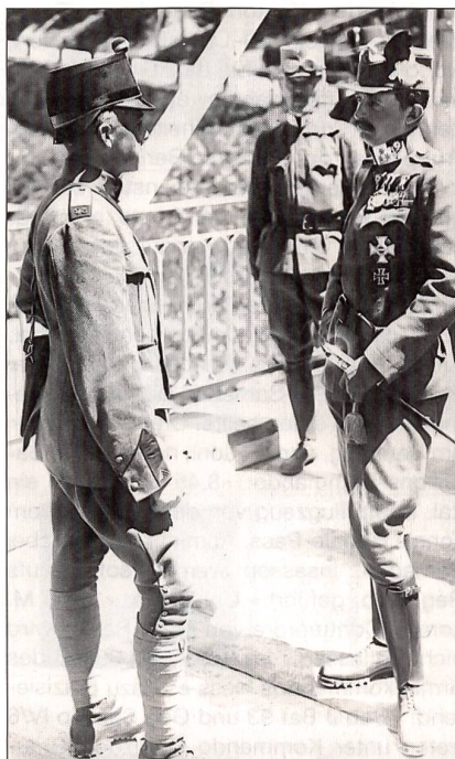
Kaiser Karl als Oberst der Tiroler Kaiserschützen mit dem für die Gebirgstruppen typischen kurzen Säbel.

Atempause gewährt. Und so brachte denn auch die Verlegung deutscher und österreichischer Streitkräfte auf die westlichen Kriegsschauplätze die italienische Front beinahe zum Einsturz. Dem gegenüber stand jedoch der Kriegseintritt der USA vom April 1917 und damit der endgültige Umschwung zugunsten der Entente. In diese Zeit fiel nun der Aufenthalt des Kaisers in Martinsbruck. Der Monarch befand sich mit seinem Stab wohl auf der Fahrt via Nauders ins Südtiroler Kampfgebiet oder von dorthier kommend auf der Heimreise. Kaiser Karl galt als mutiger Sol-