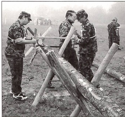
Auf dem Posten Überraschung war handwerkliche Geschicklichkeit gefordert.

mit Hindernissen des Pferdesportes, erwies sich als anspruchsvoll, was sich in den Resultaten widerspiegelte. Beim HG-Werfen galt es 4 Ziele auf verschiedene Distanzen zu treffen. Jedem Patrouilleur standen 8 Würfe zu. Die Trefferquoten fielen recht unterschiedlich aus. Beim Überraschungsposten hatten die Wettkämpferinnen und Wettkämpfer eine besondere Aufgabe zu lösen. Mit einer Handsäge musste von einem Baumstamm ein Stück von bestimmter Länge abgeschnitten werden. Es zeigte sich, dass viele Teilnehmer über ein gutes Augenmass verfügen. Der Wettkampf, welcher unfallfrei verlief, wurde von zahlreichen Ehrengästen mit grossem Interesse verfolgt.