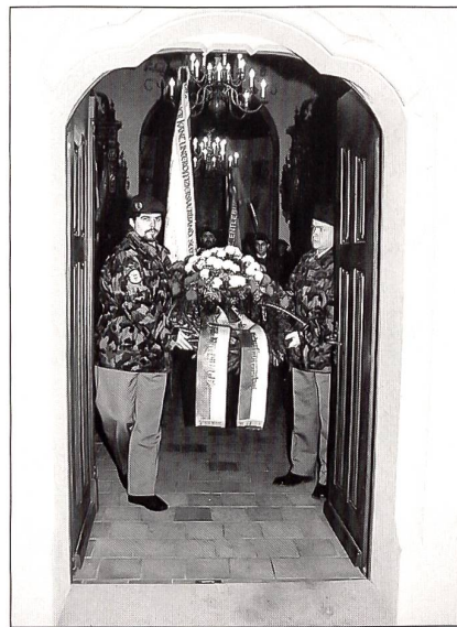
Feierliche Kranzniederlegung zum Gedenken an die vor 800 Jahren verstorbenen Soldaten.