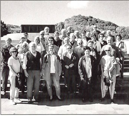
Die Reisegruppe auf dem Hartmannsweilerkopf.