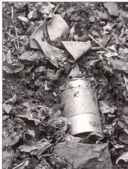
Eine gefundene KB1

Basis durch diese auslandeinsatzerfahrenen KAMIBES-Instruktoren vorbereitet. Unterstützt durch drei internationale Experten aus Grossbritannien und Deutschland, folgte in einem 5-wöchigen Kurs mit einer 3-tägigen Einsatzüberprüfung die Ausbildung zu Supervisoren für Auslandseinsätze im Bereich der humanitären Minenräumung.