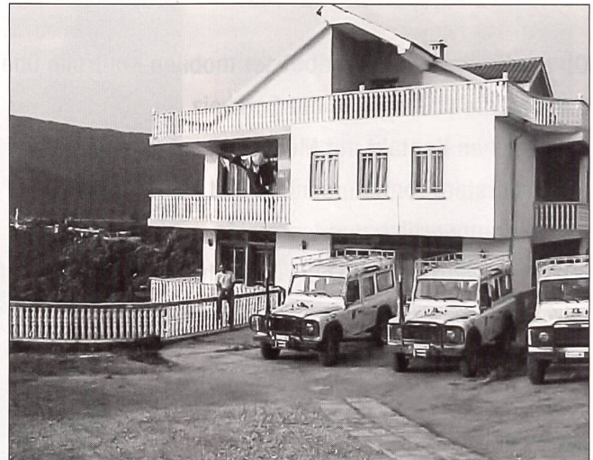
Die Basis des Schweizer Teams in Kukes.