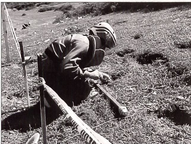
Deminer im Einsatz mit Prodder.

Einsatz nach Bosnien geschickt. In einer 2. Phase wurden im Jahr 2000 erstmals in der Schweiz fünf AdFWK auf freiwilliger