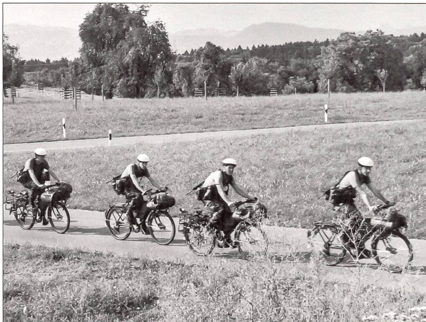
Eine Gruppe auf dem Radmarsch. Für Verschiebungen sind die weissen Velohelme vorgeschrieben.

Vom Ricken her kommend fahren drei Gruppen Radfahrer in schnellem Tempo auf ihren Armeerädern Fahrrad 93 Richtung Gossau bei Zürich. Die Radfahrer haben bereits 20 km Radmarsch hinter sich. Der Einweisposten verlässt kurz seine