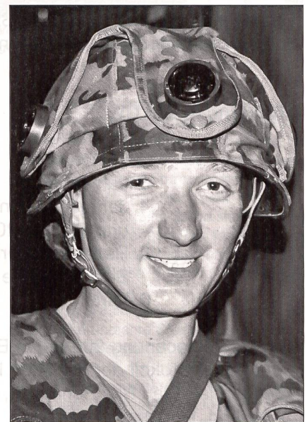
«Im WK läuft viel, ich hoffe, dass wir als ganze Kompanie umgeteilt werden!»

Der Wiederholungskurs wird mit der dreitägigen Bataillonsübung «Armstrong» beendet. Vom WK-Standort der Kompanien aus führt die Marschroute durchs Glarnerland, über den Klausenpass nach Brunnen, Weggis, Einsiedeln zur Fahnenabgabe nach Rapperswil. Der 224 km lange Radmarsch stellt hohe physische Anforderungen an die Wehrmänner und ist zweifellos