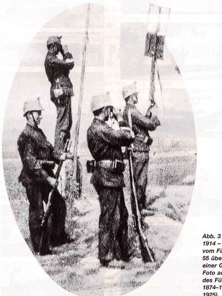
Abb. 3 1914 – Signalisten vom Füsilier-Bataillon 55 übermitteln mit einer Gewehrflagge.