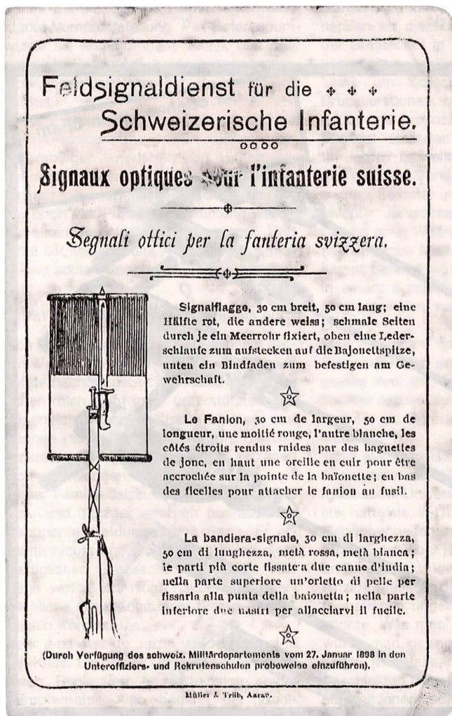
Abb. 1 Reglement 1898 für den versuchsweisen Feldsignaldienst der Infanterie.

Am 27. Januar 1898 wurde durch Verfügung des Eidgenössischen Militärdepartements in den Unteroffiziers- und Rekrutenschulen der Infanterie der Feldsignaldienst mit so genannten Gewehrflaggen probeweise eingeführt. Dazu erhielt jeder Zug als Korpsmaterial zwei 30 x 50 cm grosse, horizontal geteilte, rot-weiße Signalflaggen (Sender und Empfänger). Die an den Schmalseiten durch Meerrohr verstärkten Flaggen wurden an der Spitze des aufgefanzten Bajonetts fixiert und zugleich am Gewehrschaft festgebunden