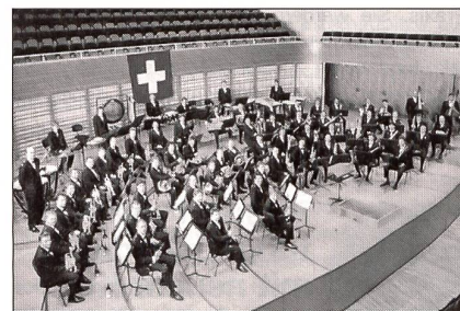
Allzeit und überall beliebt: unsere Militärmusik.