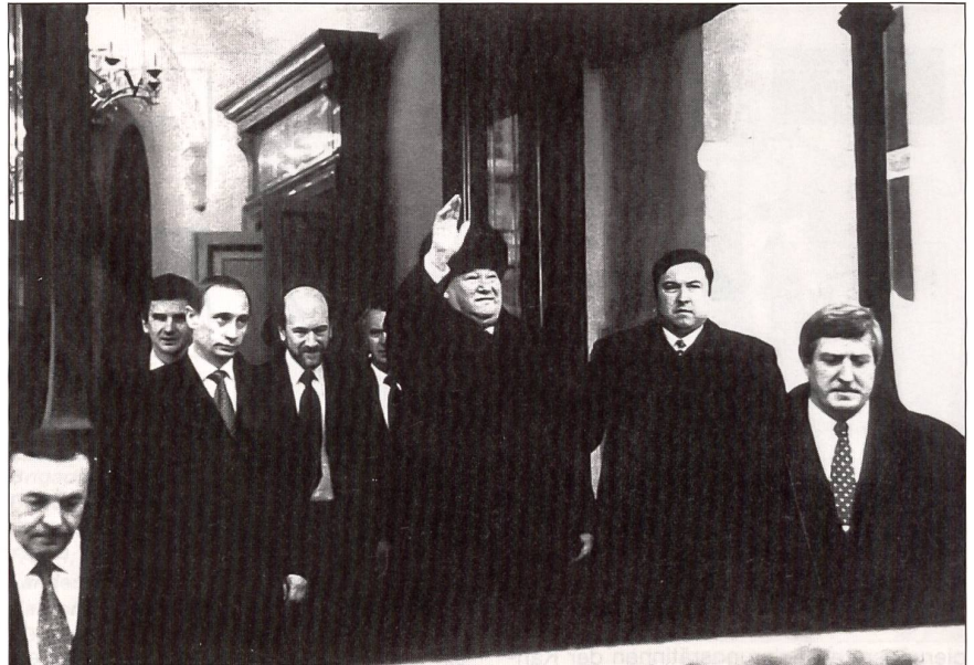
Machtübergabe an Regierungschef Wladimir Putin nach der Rücktrittserklärung am 31. Dezember 1999 im Kreml.

stärker über die Zeit nach Jelzin nachzudenken. Sie hatten lange das Augenmerk auf Lebed gerichtet. Er besass Ausstrahlung, verfügte sowohl in der Bevölkerung als auch in der Armee über eine grosse Popularität. Lebed war ein Mann der Ordnung. Aber jetzt war dieser für die «Familie» ausgeschieden. Jelzin selbst widmet in seinem dritten Buch ein ganzes Kapitel dem Thema Generäle. Jelzin studiert die Biografien berühmter Feldherren. Er vertieft sich in die Geschichte. Denn er glaubt, dass dieses riesige Reich Russland von einem Hauptproblem geschüttelt wird: Es krankt an mangelnder Ordnung. Die Gesetze werden zu sehr verletzt, Schlendrian und Trunksucht sind eine Geissel der Menschen. Und Jelzin hat am eigenen Leib erfahren, wovon er spricht. Er bewegt sich, so gesteht er selbst, ständig mindestens am Rand der Trunksucht. Bestechlichkeit und Unehrllichkeit plagten das Land. «Ich begann», schreibt der Präsident, «über die Generäle nachzudenken.» Aber sein Befund ist niederschmetternd: «Ich lernte den General ohne Überzeugung kennen.» Und einmal mehr ruft Jelzin pathetisch aus: «Wie viele bescheidene, gebildete Zivilis-