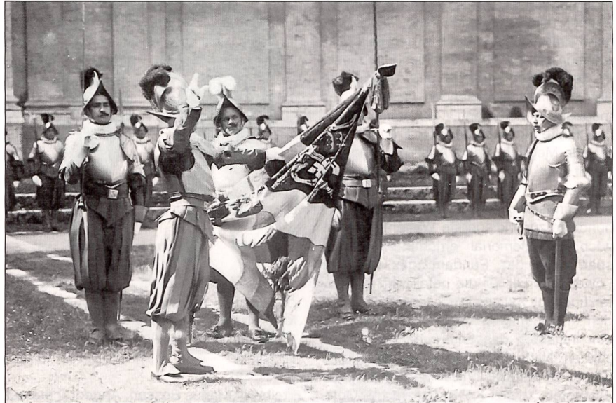
Vereidigung im Hof des Belvedere um 1930.

Ende 1526 hatten sich spanische Söldner des kaiserlichen Heerführers, Herzog Karl von Bourbon (1490–1527), in Italien mit den über die Alpen entsandten deutschen Landsknechten des Feldhauptmanns Jörg von Frundsberg (1473–1528) vereinigt. Als der Waffengang sich zu Ungunsten der Allianz entwickelte, bot der Papst Waffenstillstand an. Das gegnerische Lager, ver-