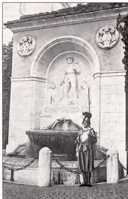
Das Ehrenmal im Gardequartier erinnert an die Gefallenen des 6. Mai 1527.