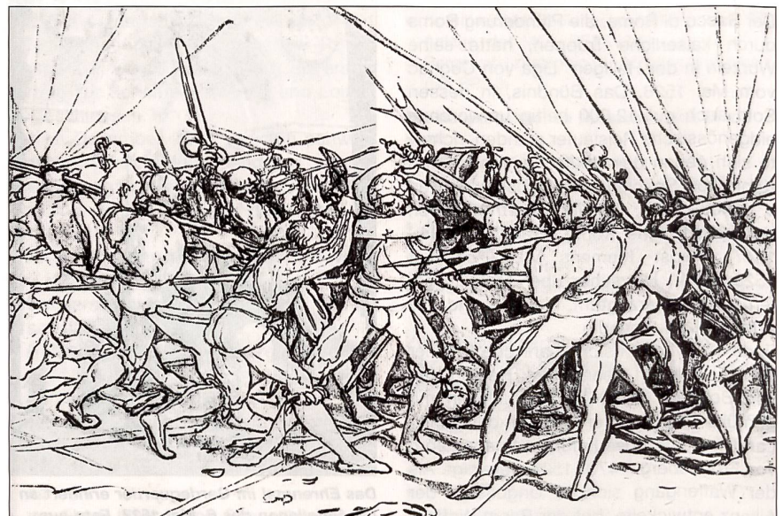
Infanterieschlacht zur Zeit des Sacco di Roma. Zeichnung von Hans Holbein d. J.

Am Donnerstag, dem 20. Oktober, am Höhepunkt der Reise, fand morgens auf dem «Campo Santo Teutonico» ein Requiem für die Gefallenen von 1527 statt. Der deutsche Friedhof im Vatikan ist bekanntlich letzte Ruhestätte zahlreicher Schweizergardisten. Der Denkmalsweihe