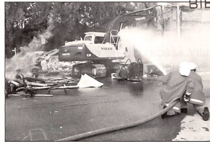
Titelbild: Mit grossem Einsatz dabei: Rettungstrupp arbeitet sich vor.