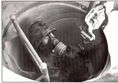
Eng ists da drunten bei den Spinnen!

Meine Besuchsrunde geht wieder ins Rhonetal hinunter. Hier treffe ich auf ein gemütliches Biwak. Die Rekruten haben da übernachtet und waren auf Piktett. Sie lassen sich gerade ein gutes, heisses Mittagessen aus den Kochkisten schmecken, mitten in einem Weinberg. Sie sind in der Duchhalteübung über mehrere Tage. Wenig Schlaf, viel Einsatz. Aber keiner schlurft oder motzt, die Motivation ist immer noch hoch. In kleinen Gruppen geht es nun darum, ein Sprengobjekt für die Sprengung vorzubereiten und – supponiert natürlich – zu sprengen. Hier treffe ich einen der jungen Leutnants, die im Frühling brevetiert wurden. Er fühlt sich wohl in seiner Einheit, wo er seinen Grad abverdient. Hier laufe etwas, das sei ein lebendiger Einsatz und Umsetzung des in der OS Gelernten. Ein fröhlicher, junger Tessiner Instruktor erklärt mir alles sehr genau. Ich steige mit ins Sprengobjekt ein. Worauf habe ich mich da eingelassen? Diese steilen und hohen Treppen und ich mit meinen untrainierten, kurzen Beinen! Es gibt kein Zurück, wer A sagt, muss auch B sagen. Es ist ungeheuer spannend. Endlich ist wieder ein Lichtschein zu sehen. Die Sprengobjekte in der Schweiz sind auch in Friedenszeiten geladen. Im Ernstfall wird nur noch der Zünder angebracht, nach einem sehr komplizierten Schema, damit keine zufälligen Fehler passieren. Die Unterlagen dazu sind GEHEIM klassifiziert. Jeder Rekrut der Festungspioniere muss jeden Arbeitsschritt