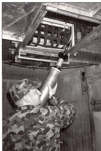
Im Munitionsraum im Bunker.

Die Frage brennt mir unter den Nägeln. Natürlich sind auch die Festungstruppen von A XXI betroffen. Es lässt sich noch nicht viel darüber sagen. Bereits sind ja einige Festungen geschlossen worden, das ist bekannt. Die Ausbildungsanlage Därstetten wird dort nicht weiter betrieben. Umschulungen und Umteilungen hat es aber immer gegeben auf neue oder aufgewertete Waffensysteme, man denke nur an die Umschulungen auf Panzer, Flugzeuge oder Sturmgewehr 90, oder eben s. Zt. die Umschulung vom fahrenden Centurion auf die Centi-Bunker gleichen Kalibers. Die jetzt ausgebildeten Rekruten und neu brevetierten Offiziere werden auf jeden Fall nicht einfach ausgemustert und nutzlos. Sie erhalten interessante und vielseitige Aufgaben im Rahmen der Unterstützungstruppen. Gerade die jetzt junge Generation ist ja generell allem Neuen und Abwechslungen gegenüber aufgeschlossen, lernfähig und lernbereit. A XXI wird für sie zu einer Herausforderung, die sie bestimmt positiv und erfolgreich angehen und meistern. Wir werden immer noch Festungsminenwerfer und den BISON haben, und auch die Sprengobjekte sind weiterhin geladen. Alle Funktionen werden Platz haben unter anderen Strukturen. Die Schutzheilige der Artillerie und der Sprengmeister,