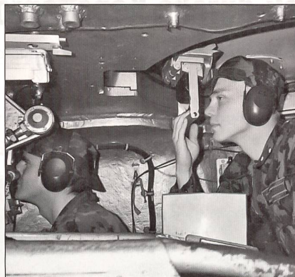
Richter und Beobachter an der Arbeit.

Einige Wochen später besuchte ich die Jüngsten der Festungstruppen: die Festungsrekruitenschule 258, die in Sion beheimatet ist. Sie sind im Simplongebiet in