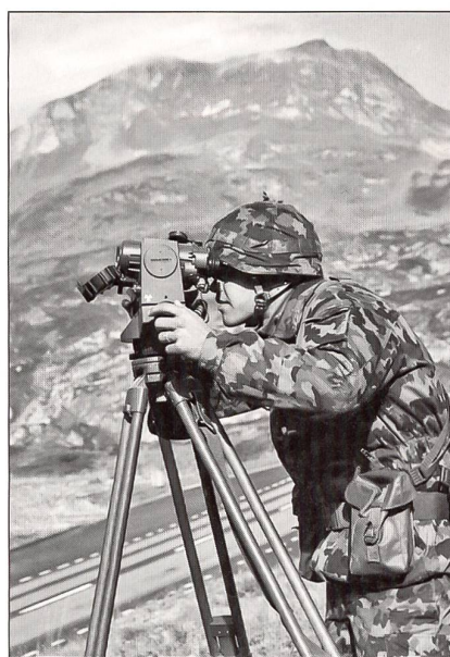
Beobachterposten: Beobachter, Vermesser und Zeichner an der Arbeit.

der Schiessverlegung. Ihr Kommandant, Oberst i Gst Yves Gaillard, nimmt sich einen ganzen Tag Zeit, mit mir unterwegs zu sein. Das ist grossartig. Ich danke ihm herzlich. Im Kommandogebäude in Brig gibt er mir eine gute Einführung ab Computerpräsentation. Auftrag der Festungstruppen mit und ohne Kampftruppen im Raum, Führungsinfrastruktur, Kampfinfrastruktur, Funktionen in der Festungstruppe. Das aber sind alles Menschen, und da ist auch die Rolle des Chefs wichtig: Führung, Ausbildung, Personelles, Kontakt mit Dritten. Die ganze Rekrutenschule rollt er wie eine Landkarte vor mir auf: Planung der Schule, Organisation der Einheiten, Einrichtungen und Ausbildungsplätze. Auch er ist aber nicht verschont von «familiären» Problemen in der Verantwortung für seine Jungs, seine Rekruten: Er befasst sich mit Kadernachwuchs, Bestandesverwaltung, Sicherheit, vorzeitige Entlassungen aus der RS, Dienstmotivation sind ihm grosse und wichtige Anliegen, Drogen bekämpft er strikte. Seine Schule ist drei-