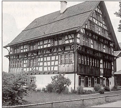
Dieser herrschaftliche Riegelbau im Herisauer Gemeindeteil Schwänberg war Mitte des 17. Jahrhunderts Sitz des Appenzeller Militärhauptmanns Hans Conrad Zuberbühler. Heute sind gewisse Räume des Hauses öffentlich zugänglich für Bankette und Seminarien, und ein kleines Museum veranschaulicht die Geschichte des idyllischen Weilers Schwänberg.

fenbar auch um eine einheitliche, ordnungsmässige Uniformierung seiner Kompanie bemüht, welche aus blauem Rock mit rotem Futter, weissen Hosen, weissen Strümpfen und weisser Weste sowie einem Hut mit aufgesetztem weiss-schwarzem