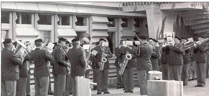
Das Inspektionsspiel Herisau im Einsatz.

Mit der Reduktion der Armee-, der Regiments- und Bataillonsspiele wird dem ausserdienstlichen Inspektionsspiel Herisau eine noch bedeutendere Rolle zukommen.