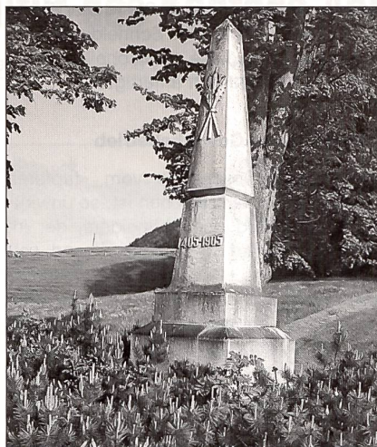
Ein Denkmal erinnert noch heute an den Sieg der Appenzeller am Stoss.

Kulturschaffende aus beiden Halbkantonen beteiligt sein sollen. Konkrete Projekte bestehen hier allerdings noch nicht. Über das Jubiläumjahr verteilt ist im Appenzellerland ein Zyklus von Feierlichkeiten geplant. Als herausragendes Ereignis gilt dabei ein grosses Festspiel im Hof des Gymnasiums in Appenzell. Sowohl die traditionelle Stosswallfahrt als auch das jährlich stattfindende Stossschiessen werden im Jahre 2005 mit Sicherheit in einem besonders feierlichen Rahmen stattfinden. Ferner ist in Appenzell ein umfangreiches Dorrfest in Vorbereitung. Die Museen des Appenzellerlandes planen eine gemeinsame Museumsnacht. Ebenfalls im Jahre 2005 wird der Abschlussbericht des archäologischen Forschungsvorhabens auf den Burgruinen Clanx und Schönenbüel der Öffentlichkeit übergeben. Dieses Projekt wurde im Hinblick auf das Stossjubiläum bereits im vergangenen Jahr mit Hilfe des Schweizerischen Nationalfonds in Angriff genommen. Weitere