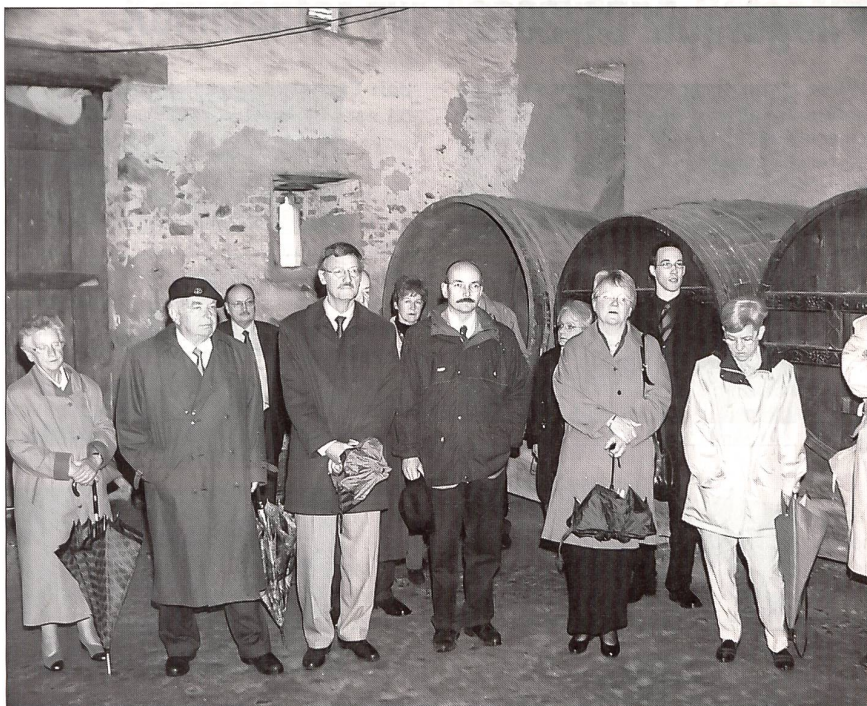
Die GV-Besucher bei der Stadtführung in der Klosterrotte.