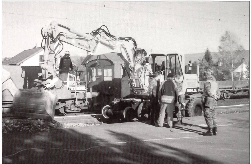
Bmfhr Martin Ettenschwiler füllt das leere «Gleis» mit Schotter aus.

Neben dem Stationsgebäude in Dotzigen, auf der Strecke der S-Bahn-Linie 36 zwischen Lyss und Büren an der Aare gelegen, soll der Bahnübergang und die Barriere aufgehoben werden. Deshalb muss die Station verlegt werden, gleichzeitig wird die Zuckerrübenverladeanlage aufgehoben. Die Landwirte aus der Umgebung von Dotzigen müssen jetzt auf der Strasse mit ihrer Ware direkt nach Aarberg fahren. Für die SBB AG ein Desinvestitionsauftrag an die Armee! Die Truppe macht natürlich lieber Aufbauarbeiten, aber auch für den Abbruch der Gleise ist sie bestens geschult. Für die Eisb Sap Kp I/31 also