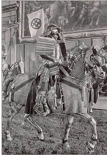
Berittener japanischer Samurai um 1800.

Die Sammlung der Feuerwaffen gehört zum Luxuriösesten, was weltweit zu be-