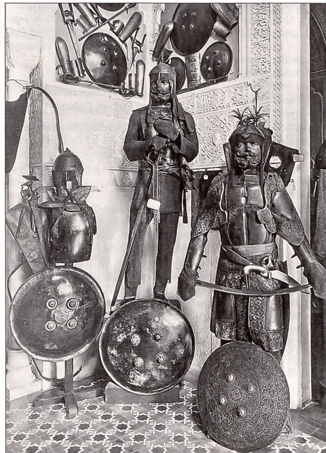
Indische Rüstungen und Schilde.

Die nähere Prüfung der Objekte enthüllte überraschenderweise, dass ein Teil der Harnische Rekonstruktionen des endenden 19. und beginnenden 20. Jahrhunderts sind, was die Presse zu abwertenden Kommentaren zur gesamten Sammlung zum Anlass nahm. Dies zu Unrecht, enthält doch der stibbertsche Besitz eine ganze Reihe hochwertiger Rüstungen und