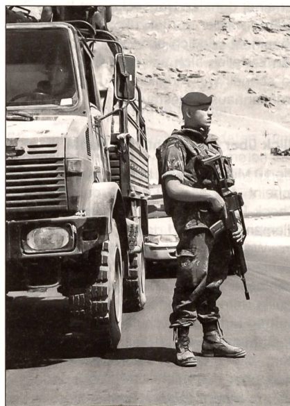
Bei jedem Halt wird eine Sicherung aufgezogen. Die deutschen Soldaten sind mit dem Sturmgewehr G36 ausgerüstet.

nicht immer klar, welche Polizeistation zu welchem Distrikt gehört. Die Kolonne fährt zuerst eine falsche Station an, wird dann aber an die richtige weiterverwiesen. Nach der Ankunft vor der richtigen Polizeistation zieht der Patrouillenführer seine Panzerweste aus und tritt mit dem Übersetzer in die Polizeistation ein. Sie wollen sich vorstellen. Die Afghanen sind sehr gastfreundlich; Tee wird ausgeschenkt und etwas zum Essen verteilt. Während in der Station diskutiert wird, gibt es ausserhalb des Gebäudes erneut einen Menschaufmarsch. Plötzlich sind Dutzende von Kindern da. Sie sind neugierig und wollen sich alles genau anschauen. Einzelne Bundeswehrosoldaten können einige Brocken Dari oder Paschtu und versuchen sich mit ihnen zu unterhalten. Viele Kinder sprechen auch Englisch. Gelernt haben sie die Sprache während der vielen Jahre in den pakistanischen Flüchtlingslagern. Trotz der friedlichen Szene haben die Soldaten stets ein