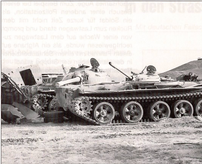
Am Wegrand: Zeugen des Krieges.

lokale Übersetzer. Die Passwörter werden ausgetauscht, und nach dem Zuruf von «Amnat Hast» (= Sicherheit) durch den Kontrolleur dürfen die Fahrzeuge weiterfahren. Solche Kontrollen wiederholen sich in dieser Nacht noch über 20-mal. «Ein unangenehmes Gefühl für einen Soldaten, sich mit einer Waffe im Anschlag kontrollieren zu lassen», meint Feldweibel Ronny S. zum Ablauf der Kontrollen. Doch nicht alle Strassensperren werden gleich strikt durchgeführt. Teilweise erkennt man schlafende Soldaten im Hintergrund. Es sind nicht die einzigen in dieser Nacht, die vom Schlaf übermannt wurden. Viele Hilfsorganisationen haben vor ihren Gebäuden Wachhäuser, und nicht wenige der bewaffneten Wächter «pennen», als unsere Kolonne vorbeifährt.