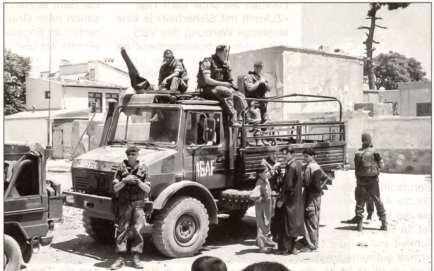
Auf dem 2-Tonnen-Mercedes-Unimog ist ein Maschinengewehr MG3 montiert.

Nach der Befehlsausgabe nimmt sich ein Unteroffizier eine Gruppe junger Soldaten