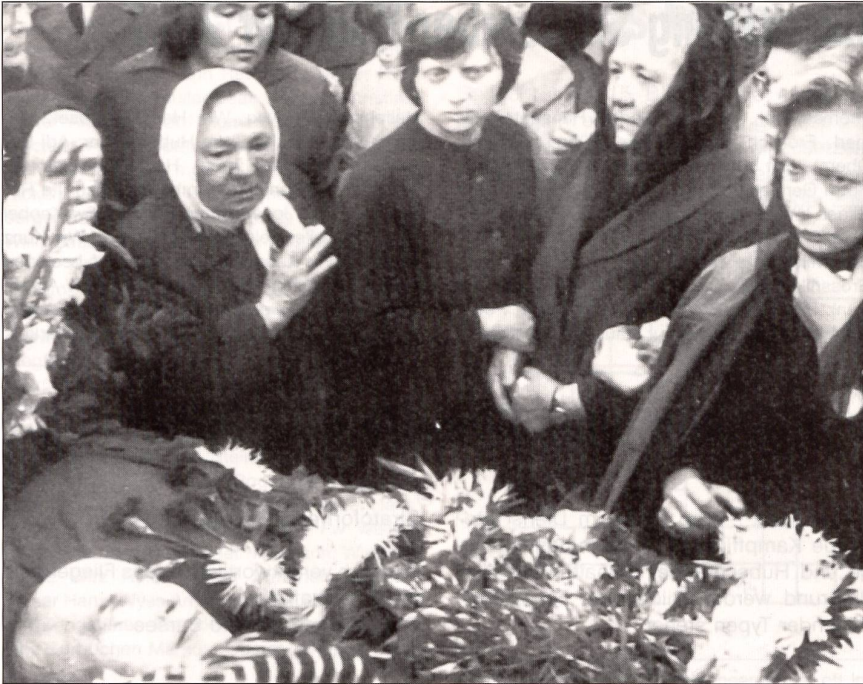
Im Kreise seiner Familie und einiger Freunde wird Chruschtschow beigesetzt.

5. März 1953. Sofort entbrannte der Streit um dessen Erbe. Es gelang Chruschtschow, sich gegen die scheinbar mächtigeren und stärkeren Rivalen durchzusetzen.