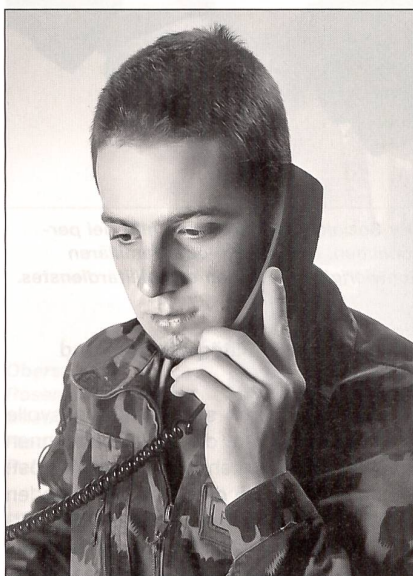
Drückende Sorgen? – Versuch es mit der Gratisnummer 0800 855 844

Der SDA hat bereits eine fast 100-jährige Tradition. In dieser Zeit hat sich selbstverständlich auch der SDA (früher Zentralstelle für Soldatenfürsorge) gewandelt und sich den aktuellen Bedürfnissen angepasst. Insbesondere die Reorganisation von 1996 war sehr radikal, indem der SDA organisatorisch von der Schweizerischen Nationalspende für unsere Soldaten und