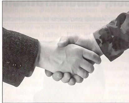
Der Sozialdienst der Armee hilft bei persönlichen, beruflichen oder familiären Schwierigkeiten wegen des Militärdienstes.

Das jahrelange Begehren um Rückvergütung der Krankenkassenprämien wurde nun endlich per 1.1.2001 erfüllt. Die Schönheitsfehler sind, dass eine Sistierung nur nach 60 aufeinander folgenden Dienstagen erfolgen kann und erst nach dem geleisteten Dienst abgerechnet wird. Dies ist für den AdA erfreulich. Für den Sozialdienst wird es keine Entlastung geben. Aber trotzdem, wenigstens ein Teilerfolg!