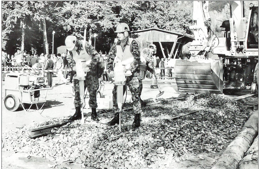
Eisenbahnsappeure beim Gleisbau

Positiv: Dass in der Genie RS 256/02 pro Monat eine Lohnsumme von (inklusive Kader) fast 900 000 Franken ausbezahlt wird. Negativ: Seit Beginn der RS vor 11 Wochen mussten – aus verschiedenen medizinischen Gründen – sage und schreibe 103 Mann entlassen werden. Die meisten davon in den ersten 14 Tagen. Diese Zahl gibt zu denken! König informierte im Film-