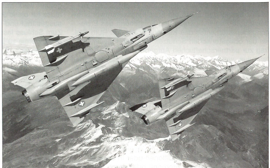
2 Mirages III S überm Turtmantal/Brunegg.

All diese Fakten führten dazu, dass die ganze Schulung von Militär- und Zivilpiloten neu überdacht werden musste.