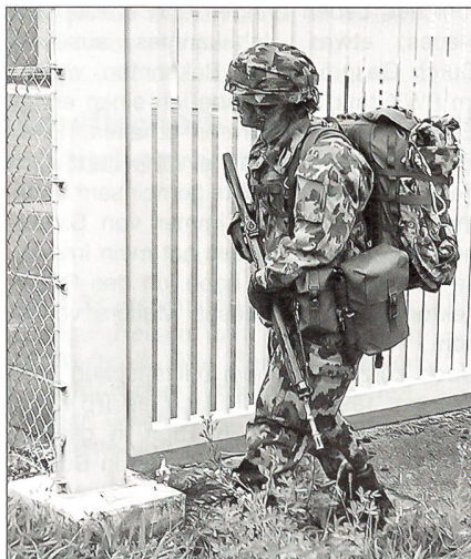
Vorsichtig nähert man sich dem Ziel.

Gut – wir haben uns immer und in jeder Situation geholfen. Die Kameradschaft wurde grossgeschrieben und wir haben viel voneinander profitiert. Ich habe mich immer etwas als der ruhende Pol in dieser Schule gefühlt und wurde dementsprechend in kniffligen Situationen immer wieder involviert.