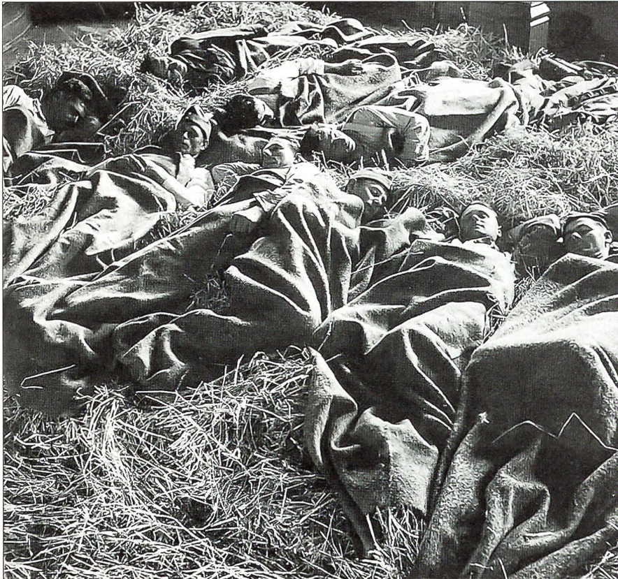
Unterkunft im Heu