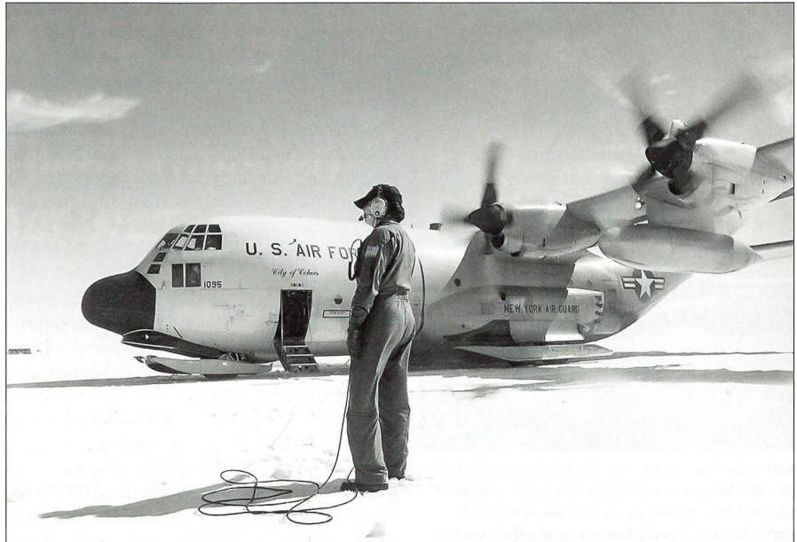
Jeweils nach der Landung steigt der Loadmaster zuerst aus und überwacht das Ein- und Aussteigen aus der Maschine.

Die grauen LC-130 Ski-«Hercules» mit ihrem orangen Seitenleitwerk und Flügelspitzen sind die Arbeitstiere in der Arktis. Die angeflogene Station Summit ist auf dem Landweg nicht zu versorgen. Zwar fliegen auch regelmässig kleinere Maschinen wie die Twin Otter einer privaten Trans-