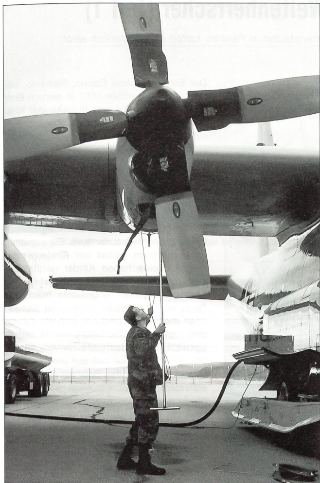
Der tägliche Unterhalt auf der ehemaligen US-Luftwaffenbasis von Kangurlussuaq.

Referenzen anders sind, stelle besondere Anforderungen, erklärt Colonel Gomula. Zwar verfügt die LC-130 über diverse moderne Navigationshilfen wie zum Beispiel ein Global Positioning System (GPS), doch die LC-130-Crews vertrauen als einzige USAF-Einheit noch auf eine altbewährte Navigationshilfe: den Sextanten aus der Seefahrt.