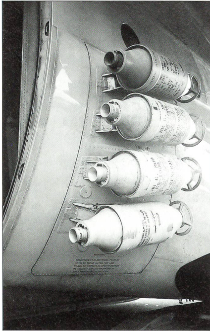
Auf Höhe der hinteren Seitentüren können je vier ATO-Startraketen montiert werden. Einmal gezündet, brennen sie während zehn bis elf Sekunden ab und erhöhen mit ihrem Schub die Geschwindigkeit um rund sieben bis acht zusätzliche Knoten.