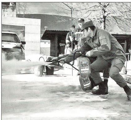
Übungsteilnehmer bei der Bekämpfung von Kleinbränden.

neben den revolutionären Ausbildungsinhalten, insbesondere durch eine vorbildliche Didaktik, grosse Effizienz und tadellose Organisation aus. Von der «Methode Taylor» wurde die «Neue Gefechtsschiess Technik der Armee» (NGST) abgeleitet und schliesslich ab 1995 in der Schweizer Armee eingeführt. Ein Beweis, dass die ausserdienstliche Tätigkeit für die Armee durchaus gewinnbringend sein kann! Im gleichen Jahr drohten die SUOV-Kurse auszufallen, weil sich keine Personen fanden, die deren Organisation übernehmen wollten. Schliesslich konnte das Kursangebot aber bis 1997 von einer Sektion des SUOV weitergeführt werden.