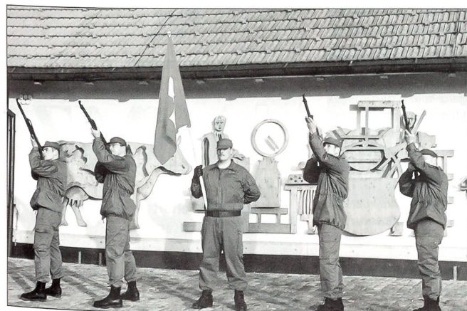
Salutschieszen einer UOV-DACHS-Delegation.

Anfang der Neunzigerjahre hatte der Schweizerische Unteroffiziersverband (SUOV) in weitsichtiger und mutiger Weise die Förderung der Schiess Technik der «Methode Taylor» in der Schweiz aktiv vorangetrieben. In Brugg/AG wurden zu diesem Zweck erste ausserdienstliche Schiesskurse angeboten. Diese zeichneten sich