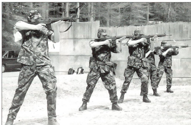
Kurzstanzschiessen: Kernkompetenz bei NGST-Kursen.