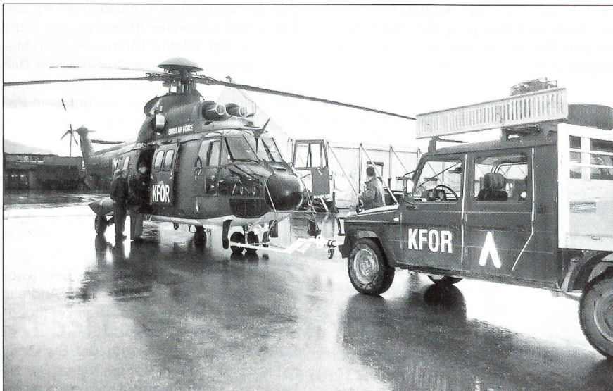
Der Schweizer Super Puma wird nach dem Flugdienst in seinen Zelthangar gestossen.

Zudem wurde die Ausrüstung der Besatzungen an die Verhältnisse im Kosovo und an die KFOR-Vorschriften angepasst. Piloten und Loadmaster tragen eine Überlebensweste, die ehemals von den Mirage-Piloten verwendet und den neuen Bedürfnissen angepasst wurde. «Auf Mann» respektive im Super Puma sind während des Fliegens für die Besatzung auch drei Rucksäcke mit Notwäsche, einer Winterjacke und Toilettenartikeln, zudem wird die Splitterschutzweste und der Schutzhelm mitgeführt. Weiter sind drei Schlafsäcke, ein Satellitentelefon, Notkocher und Essgeschirr an Bord. Alles ermöglicht bei einem Unfall oder Zwischenfall das Überleben in den Bergen Kosovos. Die vorgeschriebene Zusatzausrüstung hat nur einen Haken: Sie wiegt rund 500 kg, und logischerweise ist die Nutzlast des Super Pumas um dieses Gewicht heruntergesetzt. ☐