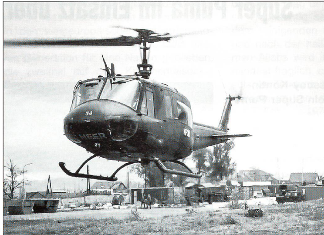
Bell UH-1D der deutschen Heeresflieger.

Grundsätzlich werden beim Fliegen die gleichen Vorschriften angewendet wie in der Schweiz. Dennoch mussten sich die