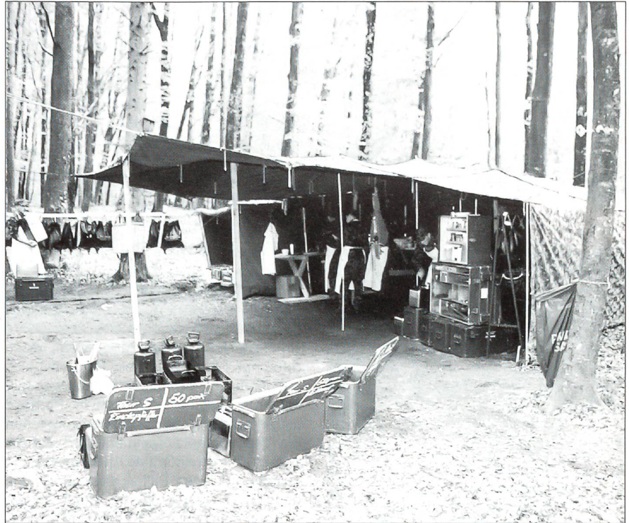
Perfekt angelegte Feldküche.

Die UOS 1/03 begann am 13. Januar 2003 in Thun mit 124 Truppenköchen. In der zweiten Woche sank der Bestand bereits auf 104, zur Brevetierung am 5. Februar traten lediglich noch 100 Aspiranten an. Unter den sieben Ticinesen, elf Romands und 82 Deutschschweizern war eine einzi-