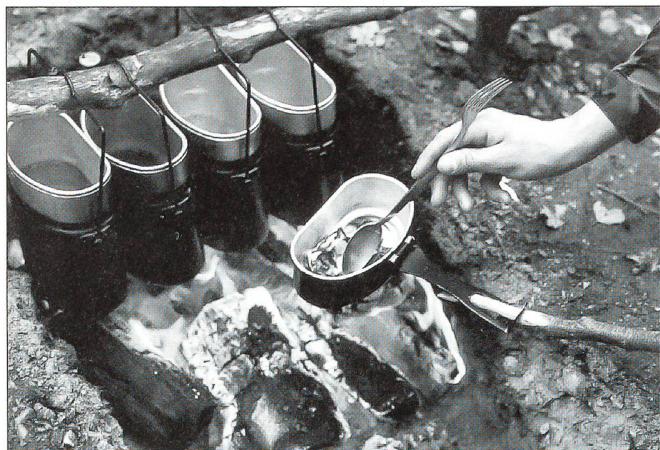
Auch die altbewährte Gabelle bringt's!