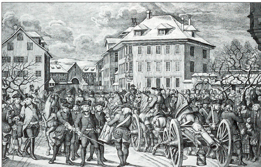
Abmarsch des zürcherischen Hilfskorps nach Bern, 1798. Besammlung im Talacker.

Geiste der persönlichen und der genossenschaftlichen Freiheit und auf der Grundlage eines neuen Bildes vom politischen Menschen, die Vereinigten Staaten gegründet werden. Ihr Freiheitskampf bleibt nicht ohne Rückwirkung auf die Alte Welt und hilft mit, den Brand der Französischen Revolution zu entfachen; in seinem Widerschein bricht gegen das Ende des Jahrhunderts das Ancien Régime zusammen. Es ist aber auch das Jahrhundert der musikalischen und dichterischen Genies, zum Beispiel Goethe und Schiller. Vor allem ist dieses 18. Jahrhundert sowohl im Geistesleben wie auch in der Politik das Jahrhundert der Aufklärung. Seine Menschen kommen sich vor als Fackelträger, die in die Zukunft hineinleuchten. Es ist ein diesseitiges Jahrhundert, erfüllt vom Glauben an den guten Menschen und einem Gottesbild huldigend, das den Herrgott distanziiert und als eine Art gütigen «Generaluhrenaufzieher des Weltgeschehens» betrachtet. Es ist dieses Jahrhun-