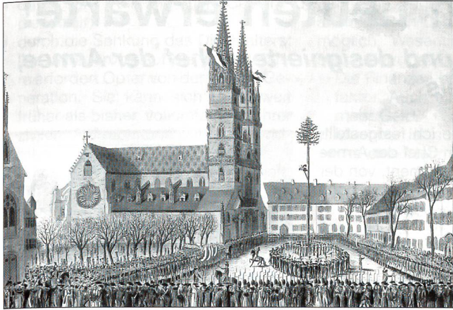
Basler Verbrüderungsfeier vom 22. Januar 1798. Zwei Tage zuvor war unter äusserem Druck die Gleichstellung des Landvolkes beschlossen worden. Tricoloren am Münster, viel Militär, kaum sichtbar einige Kinder im Tanz um den Freiheitsbaum.

zu sparen. Währenddessen bewies die Entwicklung in Frankreich, was für eine Illusion der Glaube bedeutete, es lasse sich auf die Dauer ein bewaffneter Konflikt zwischen Frankreich und den 13 Orten vermeiden.