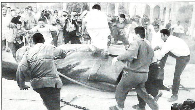
Saddam am Boden. Das Volk tritt die soeben gefällte Statue des Diktators im Zentrum von Bagdad mit Füssen.

gung kostete 500 000 Kindern das Leben. Die wirtschaftliche Entwicklung, die Forschung, die Versorgung mit Trinkwasser rutschten in eine dramatische Notsituation, welche zudem eine enorme Arbeitslosigkeit zur Folge hatte. Fünf Millionen Menschen waren als Folge des Krieges auf der Flucht, unter anderem 250 000 Palästinenser, 700 000 Ägypter und 100 000 Inder, die vor dem Krieg ihr Auskommen im Irak gefunden hatten. 1996 schloss die UN mit Irak ein Abkommen («Öl für Nahrungsmittel»), das die begrenzte Ausfuhr von irakischem Erdöl vorrangig zum Zweck der Beschaffung von Versorgungsgütern für die Bevölkerung erlaubte, deren Situation sich allerdings mit anhaltender Dauer der Sanktionen zuspitzte.