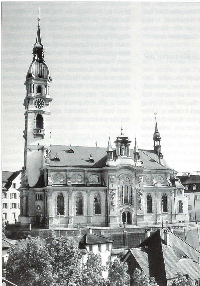
Die katholische Stadtkirche von Frauenfeld

O Thurgau, du Heimat, wie bist du so schön. Dir schmücket der Sommer die Täler und Höh'n. O Thurgau, du Heimat, wie bist du so hold, dir tauchet der Sommer die Fluren in Gold. O Land, das der Thurstrom sich windend durchfliesst, dem herrlich der Obstbaum, der Weinstock entspriesst. O Land mit den schmelzenden Wiesen besät, wo lieblich durchs Kornfeld der Abendwind weht.