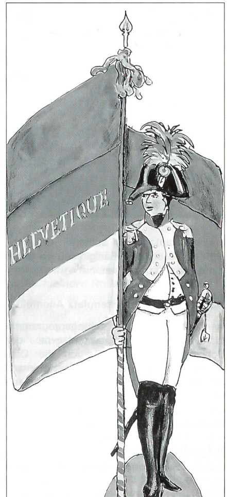
Thurgauer Soldat in der Helvetik

Tiefenbacher verstand es, die Zuhörerschaft in das Frühjahr 1803 zu versetzen und legte die Schwierigkeiten dar, die ein Tagsatzungsbeschluss auch dem Thurgau sehr zu schaffen machte. Diesem kann entnommen werden: «Die Kantone sind für die Montierung und Ausbildung ihres Bundeskontingentes an Truppen allein zuständig. Die Kantone werden aufgefordert, die Kontingente in Formation, Waffenkaliber, Dienstordnung und Besoldung anzugleichen. Ausführungsbestimmungen für die Kontingentsarmee würden an der Tagsatzung 1804 in Bern vorgelegt.» So wenig man sagen kann, der Kanton Thurgau sei aus dem Nichts entstanden, so wenig kann man sagen, das Militärwesen des neuen Kantons habe bei Null angefangen. Von der helvetischen Milizorganisation konnte je nach dem übernommen werden: die Territorialeinteilung des Kantons in vier Quar-