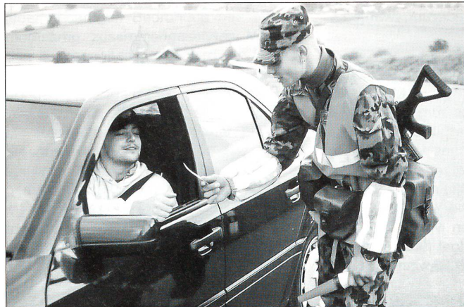
Personenkontrolle eines Festungswächters

anderer Kantone; sie schafften Gelegenheiten, die eigenen Fähigkeiten an jenen der anderen zu messen.