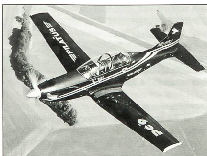
PC-9M von Pilatus Aircraft Ltd.

Irland hat sich für den Kauf von acht Turboprop-Trainingsflugzeugen des Typs Pilatus PC-9M entschieden. Sie werden die SIAI-Marchetti-Flugzeuge in der Rolle der Pilotenschulung ersetzen.