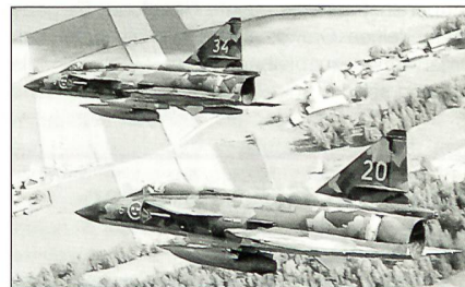
Saab Viggen der schwedischen Luftwaffe