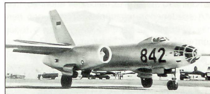
IL-28 der Luftwaffe Indonesiens

Die indonesische Luftwaffe erhielt vor vielen Jahren aus tschechoslowakischer Produktion 40 leichte sowjetische Bomber des Typs B-228, besser bekannt unter der Bezeichnung Ilyushin IL-28, NATO-Codename «Beagle».