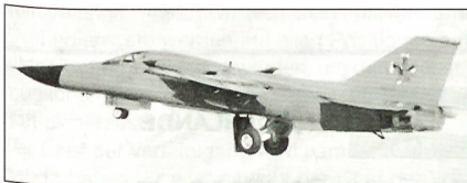
F-111C der RAAF bei der Landung in Nellis AFB, Nevada, USA

Die Royal Australian Air Force verfügt weltweit noch als einzige Luftwaffe über das schwere Tiefangriffsflugzeug General Dynamics F-111 Aardvark.