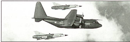
Die erste C-130-«Hercules» für Österreich, flankiert von «Draken».

Das Bundesheer hat die drei Transportflugzeuge im Vorjahr aus britischen Beständen gekauft. Sie sind seither generalüberholt und auf den neuesten Stand gebracht worden. Damit soll sichergestellt werden, dass die 35 Jahre alten Maschinen noch weitere 20 Jahre im Einsatz stehen können.