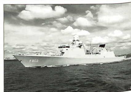
Luftverteidigungs- und Führungsfregatte De Zeven Provincien

Eine zweite Luftverteidigungs- und Führungsfregatte haben die Seestreitkräfte der Niederlande übernommen. Mitte März lieferte die Koninklijke Schelde Groep die Fregatte HNLMS Tromp aus. Das Schiff ist eines der modernsten Kriegsschiffe der Welt in seiner Klasse. Bewaffnung: Lenkwaffen: SAM ESSM, SM2-MR Block III, SSM «Harpoon», 127-mm-Kanonen Oto Melara, 2x Goalkeeper; Torpedos: 2x Double Mk. 32 mod. 9 Starter und Mk. 46 mod. 5 Torpedos.