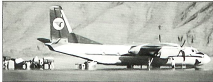
Antonov An-26 (NATO-Code CURL)

Ähnliche Veränderungen sollen bei den slowakischen Flugzeugen der Typen An-24, L-410, L-39C/ZA und bei den Hubschraubern des Typs Mi-17 und Mi-2 erfolgen.