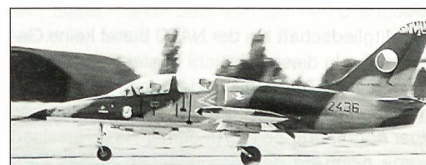
Aero L-39 Albatros

Das Air Combat Command erhielt die ersten Kampfflugzeuge des Typs Lockheed Martin F/A-22 Raptor. Tyndall AFB in Florida ist Ausbildungsbasis; die erste operationelle Staffel wird so bald als möglich auf Langley AFB, Virginia, aufgestellt.