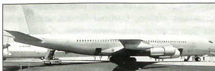
Boeing 707 der australischen Luftwaffe

Die indischen Streitkräfte erwägen die Beschaffung von drei bis sechs israelischen AWACS des Typs Phalcon. Dabei handelt es sich um Boeing 707, welche durch israelische Firmen stark modifiziert wurden.