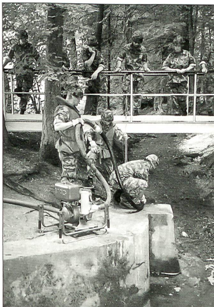
Auch beim Zusehen kann man lernen ...

Die Ausbildung zum Rettungssoldaten war sehr streng, aber auch sehr lehrreich.