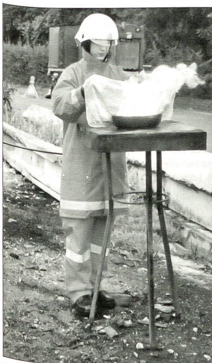
Ein Pfannenbrand wird gelöscht.

Sie findet es wichtig, dass junge Frauen, die sich für einen Einsatz in der Armee interessieren, auch von Frauen genauere Informationen erhalten, die den Militäralltag aus eigener Erfahrung kennen. Für die grundsätzlichen Informationen werden die in Zukunft abzuhaltenden Orientierungstage sicher genügen. Doch gerade spezifische Fragen kann eine Frau besser beantworten.