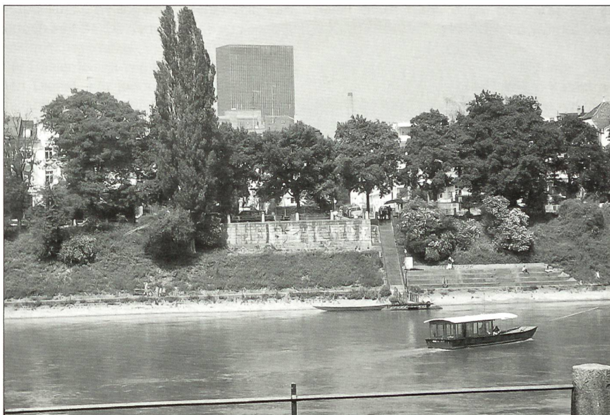
Die neueste Basler Fähre präsentiert sich vor dem Messeturm, dem höchsten Bau der Schweiz.

Die auf private Initiative zurückgehenden Institutionen «Regio Basiliensis» (1963) und die von allen drei Grenzländern gemeinsam getragene «Regio TriRhena» (1995) setzen wichtige Impulse für die gemeinsame und nachhaltige Entwicklung dieser europäischen Grenzregion. Über 100 bi- und trinationale Projekte sind so entstanden. Unter anderem der «Euro Airport Basel-Mulhouse-Freiburg», die