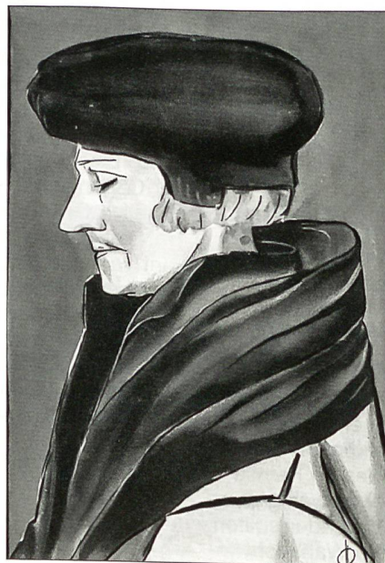
Erasmus von Rotterdam 1466–1536 (Bild von Hans Holbein dJ)

890 bis 1006 ist Basel nördliche Grenzstadt des fränkischen Königreichs Burgund. Im Jahr 1000 wird Basel freie Reichsstadt. Anno 1019 wird der romanische Neubau des Münsters vom römisch-deutschen Kaiser und Stadtheiligen Heinrich II. geweiht. 1080 entsteht mit dem Ausbau der Stadt die erste grosse Stadtmauer, und 1226 errichtet Bischof Heinrich von Thun eine der ersten Brücken über den Rhein. 1348 rottet die Pest die halbe Bevölkerung aus, und 1356 wird die Stadt von einem Erdbeben mit Feuersbrünsten zu grossen Teilen zerstört. 1362–1398 wird die äussere Stadtmauer errichtet, welche die Vorstädte einschliesst. 1392 erwirbt Basel vom Bischof Friedrich von Blankenheim die mindere Stadt Kleinbasel. 1431–1448 beherbergt die Stadt das Konzil und wird so zum Brennpunkt der damaligen Weltpolitik. 1460 stiftet Papst Pius II. die Basler Universität und 1471 gewährt Kaiser Friedrich III. Basel das Messeprivi-