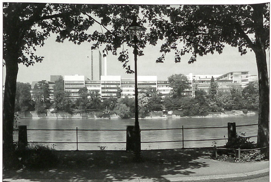
Blick auf die Basler Chemie (La Roche-Komplex).

In Basel sind rund 20 mehrheitlich international tätige Banken niedergelassen. Die UBS hat in Basel ihren Hauptsitz. Besonders wichtig ist die BIZ, die Bank für internationalen Zahlungsausgleich mit Hauptsitz in Basel. 27 Länder unterhalten in Basel ein Konsulat. Bedeutend für die Stadt sind die Global-Players und Giganten der Chemie: Novartis und Roche. Ebenfalls von internationaler Bedeutung sind die ART als Kunstmesse von Weltrang und die dahinter stehenden bedeutenden Kunstgalerien sowie die Uhren- und Schmuckmesse. Auch bedeutende internationale Handelshäuser, Finanzdienstleister und Konjunkturforschungsinstitute sind