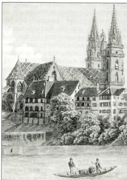
Blick auf das Münster

Im Mittelalter gab es in Basel 7 Männerklöster und Stifte, 4 Frauenklöster, 3 Ritterorden, 6 Stifts- und Pfarrkirchen und 6 Kapellen. Nach der Reformation 1529 wurden die Klöster einer weltlichen Nutzung zugeführt. Die meisten Klosterkirchen retteten sich durch die Jahrhunderte. Die Kreuzgänge hingegen wurden – mit Ausnahme des Münsterkreuzganges – alle abgerissen und anderweitig überbaut. 64 000 Basler sind protestantisch, 50 000 römisch-katholisch, 68 000 bezeichnen sich