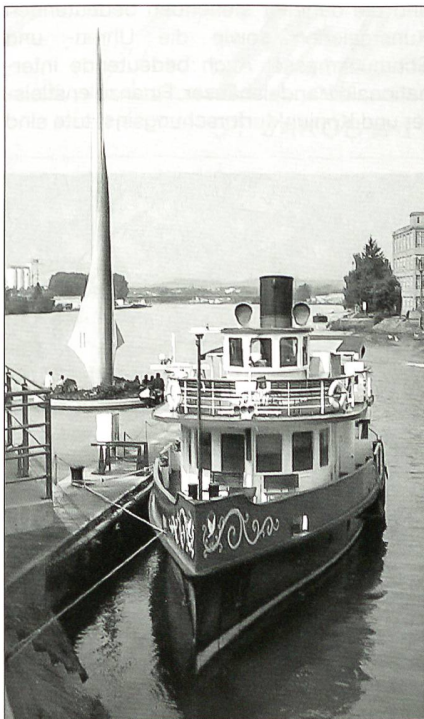
Am Dreiländereck (Schweiz, Deutschland, Frankreich) mit dem Nostalgieschiff Rhyblitz.

Basel war stets geprägt von seiner spezifischen Kultur. Die kirchliche Tradition, die