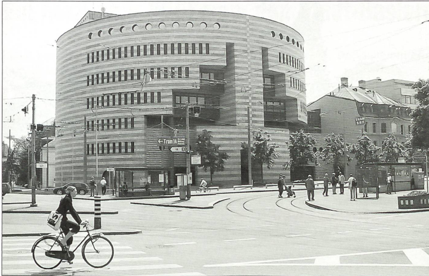
Am Aeschenplatz: der Botta-Bau der BIZ.

wie auch die Einheimischen sind immer wieder fasziniert von der Grossartigkeit des Münsterplatzes und der Gebäudefronten beidseitig des Rheines, hoch aufragend in Grossbasel, schlicht und harmonisch am Kleinbasler Ufer.