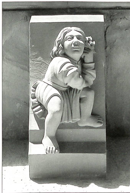
Eines der reizvollen Details am Vorwerk des Tores von Jakob Sarbach.

Was ein zünftiges Stadttor sein wollte, musste einen so genannten Vorhof haben. Dies war jenseits des Stadtgrabens eine zusätzliche Sicherungs- und Kontrolleinrichtung. Vor dem Spalentor wurde etwa gegen Ende des 15. Jh. ein solcher Hof mit zwei Rundtürmen angelegt. Der Vorhof erstreckte sich bis in die heutige Missionsstrasse auf der anderen Seite der Platzes vor dem Tor. Dort erhoben sich auch die beiden Rundtürme des Hofes. Diese Türme waren bis ins 17. Jh. relativ niedrig und hatten lediglich eine Plattform.