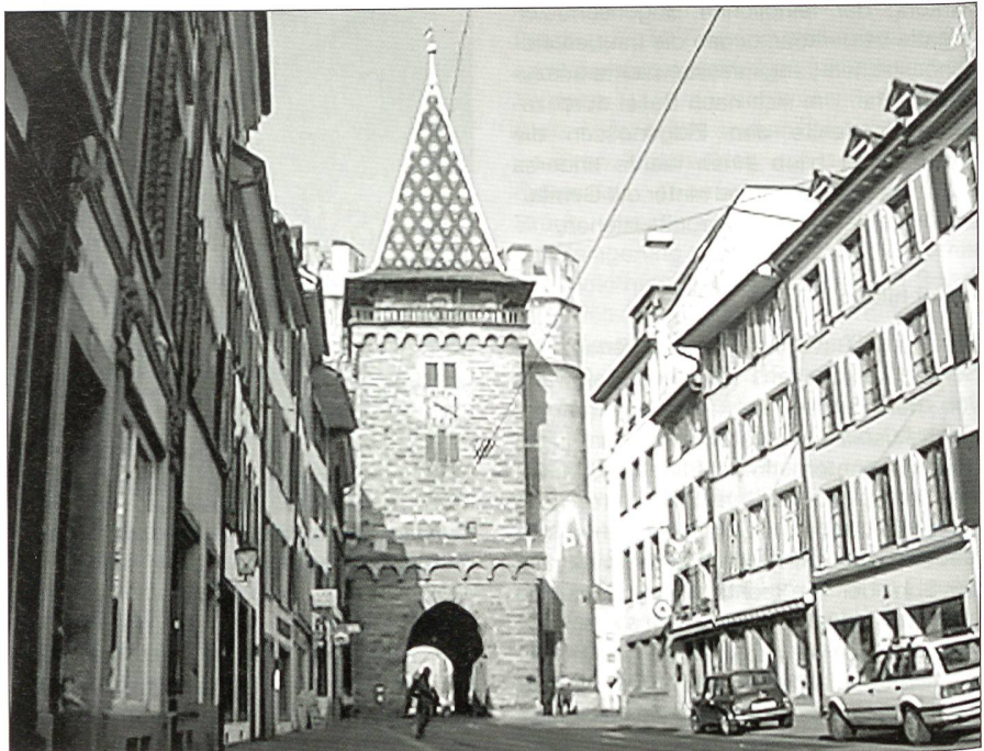
Das Spalentor von der Spalenvorstadt aus gesehen. Bei diesem Blick von der Stadtseite aus zeigt sich der quadratische Mittelurm besonders deutlich.

Die Spalenvorstadt war bereits vor dem Bau der neuen Mauer eigenständig von einem Befestigungsring umgeben. Das mag auch der Grund dafür sein, dass für das Jahr 1290, also rund hundert Jahre vor der Errichtung des heutigen Tores, an ähnlicher Stelle von einem «Voglerstor» die Rede ist. Eine Urkunde vom Januar 1300 nennt auch ein äusseres Spalentor. Dazu muss man wissen, dass damals die eigentliche Stadtmauer von 1200 ein gutes Stück hinter dem später errichteten äus-