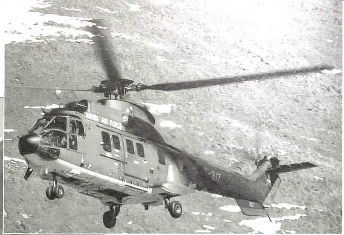
Ein Super-Puma-Helikopter bringt Gäste zum Schiessplatz Ebenfluh.