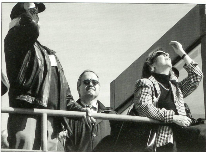
VBS-Chef, Bundesrat Samuel Schmid besuchte die Fliegerdemonstration der Luftwaffe auf der Axalp.

An den beiden Demonstrationstagen erlebten die Zuschauer eine eindruckliche Leistungsschau der Luftwaffe. Während der rund 80-minütigen Vorführungen präsentierten die Piloten ihre Mittel auf eindruckliche Weise. Vom Helirettungseinsatz mit Alouette III oder Löscheinsatz mit Super-Puma über das Kanonenschieszen der 8 F-5-Tiger der Fliegerstaffel 8 und zweier F/A-18-Hornets sowie der simulierte Luftkampf, 2 Tiger gegen 2 Hornets mit Einsatz von Flairs, beeindruckten sehr. Ein besonderes Spektakel boten die Aufklärer Mirage der Fliegerstaffel 10. Mit ihren pfeil-