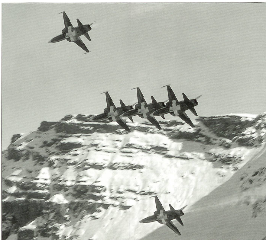
Das schöne Flugprogramm der Patrouille Suisse bot vor der herrlichen Bergkulisse einen besonderen Leckerbissen.

nahmen rund 5000 Flugbegeisterte aus nah und fern einen rund anderhalbstündigen, schweisstreibenden Fussmarsch in Kauf, um die spektakuläre Schiess- und Flugdemonstration der Schweizer Luftwaffe in der schönen Berglandschaft hoch über dem Briener See hautnah zu erleben.