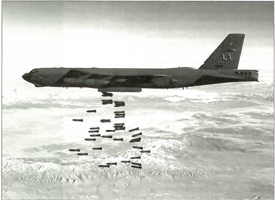
Strategischer Bomber B52: In Afghanistan und Irak konventionell eingesetzt, aber Bestandteil der nuklearen Streitmacht der USA.

Eingeschränkte strategische Handlungsfähigkeit der Supermacht Amerika wegen der Verstrickung in Vietnam, in die sie namentlich die demokratischen Administrationen Kennedy und Johnson, gewiss geleitet von hehren Absichten, doch als Ergebnis fragwürdiger strategischer Analyse, geführt hatten; Einsetzen der konsequenten Anstrengungen der neuen Administration Nixon, um die Lage generell unter Kontrolle zu bringen und, nicht allzu lange danach, die USA aus dem vietnamesischen Sumpf hinauszuführen (Waffenstillstand mit den Nordvietnamesen Anfang 1973); kühne diplomatische Initiativen dieser Regierung unter massgeblichem Einfluss von Henry Kissinger zur Herstellung normaler Beziehungen zum kommunistischen China, womit Moskaus Manövierraum eingeschränkt wurde, und zur Dämpfung des atomaren Wettrüstens