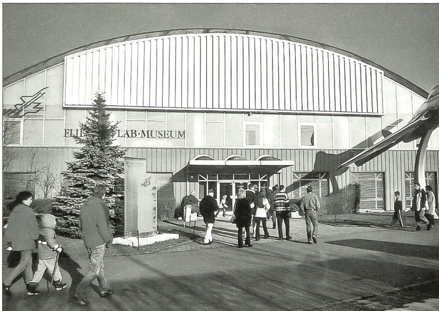
Das Flieger-Flab-Museum Dübendorf zieht immer mehr Besucher aus dem In- und Ausland an.

Im Jahre 1978 eröffnete das damalige Amt für Militärflugplätze (AMF) in Dübendorf ein Museum mit historischem Material, das bei den Fliegertruppen im Einsatz stand. Das ausgestellte Material wurde vom EMD zur Verfügung gestellt oder durch getreue Nachbauten ergänzt. Diese Flugzeugtypen wie die Blériot, die DH-1 oder DH-5, sind von pensionierten Mitarbeitern des Bundesamtes für Militärflugplätze in Buochs und Interlaken nachgebaut worden. Ein Jahr später wurde der Verein der Freunde des Museums der schweizerischen Fliegertruppe (VFMF) durch Hans Giger, Direktor AMF, gegründet. Das Sammelgut des Museums wächst in den folgenden Jahren weiter an, sodass die alten Fliegerhangars nicht mehr ausreichen, das wertvolle Material auszustellen. 1988 ist die heutige Haupthalle, eine Betonschalenkonstruktion, in Betrieb genommen worden.