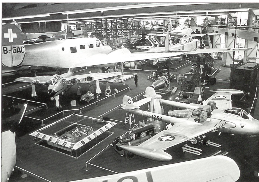
Die neue Halle 2. Im Vordergrund die Venom J-1753, dargestellt bei Wartungsarbeiten am Triebwerk.