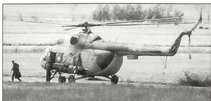
Ungarischer Mil Mi-8T Hip.

Mit Russland wurde kürzlich die Beschaffung von 42 mittleren Transporthelikoptern Mil Mi-171 Hip vereinbart; alle Maschinen sollen noch vor Ende dieses Jahres abgeliefert werden.