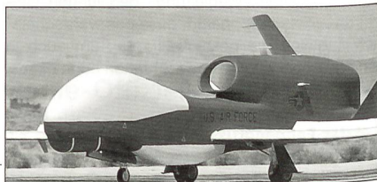
Northrop Grumman RQ-4A Global Hawk.

Mit dem Budget 2004 sollen folgende Flugzeuge beschafft werden: 22 F/A-22 Raptor, 11 C-17A Globemaster II, fünf C-130J Hercules II, 52 T-6A Texan und zwei CV-22 Osprey. Bezüglich UAV umfasst die Liste zehn MQ-1 Predator, vier MQ-9 Predator und vier RQ-4A Global Hawk.