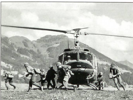
Die 7. Jägerbrigade stellte sich vor: Die «Siebente» ist die einzige Brigade in Österreich, die auch per Luftlandung eingesetzt werden kann.

Der Auftrag der Brigade ist die Sicherstellung der Einsatzbereitschaft, das ständige Bereithalten von luftlande- und gebirgskampffähigen Kaderkräften sowie die Sicherstellung der Auftragserfüllung im Rahmen internationaler Einsätze.