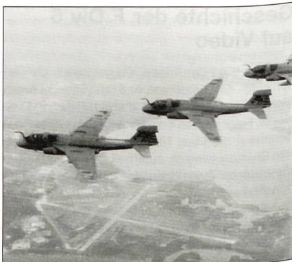
Grumman AE-6B Prowler.

Ab dem Jahr 2006 wird gemäss aktueller Planung das EKF-Kampfflugzeug Grumman EA-6B Prowler ersetzt durch die Boeing E/A-18G Growler.