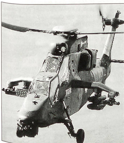
Division Luftbewegliche Operationen: der Kampfhubschrauber «Tiger» (von Eurocopter)

Die Bundeswehr verfügt in der neuen Struktur «Heer der Zukunft» über die «Division Luftbewegliche Operationen» (DLO). Stab und Stabskompanie (etwa 350 Personen) sind seit Oktober des Vorjahres offiziell in Dienst gestellt. In ihrer Zielstruktur soll die Division die Heeresfliegerbrigade 3 (in Mending), die Luftmechanisierte Brigade 1 (in Fitzlar) mit allen unterstellten Verbänden und Einheiten, das Fernmeldebataillon