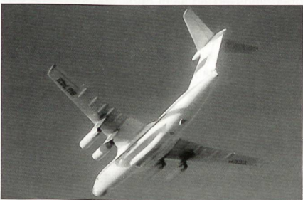
Russische IL-76 Candid.

Infolge Verzögerungen bei den Transportflugzeug-Programmen Antonow AN-70 und Ilyushin IL-330 sollen für die russische Luftwaffe weiterhin Ilyushin IL-76 Candid in Serie gebaut werden. Allerdings wird die Produktion im nächsten Jahr verlegt von Taschkent/Usbekistan nach Voronezh in Russland.