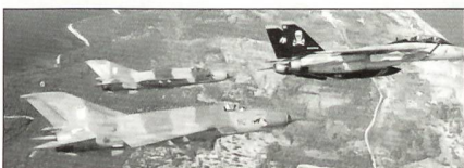
Kroatische MiG-21 bis Fishbed-L mit F-14B Tomcat der US Navy.

Die Luftwaffe Nordkoreas verfügt gegenwärtig über folgende Bestände an Kampfflugzeugen: 30 Suchoi Fitter, 36 Suchoi SU-25 Frogfoot, 40 MiG-29 Fulcrum, 50 IL-28 Beagle, 56 MiG-23 Flogger, 100 MiG-19 Farmer, 110 MiG-17 Fagot und 190 MiG-21 Fishbed.