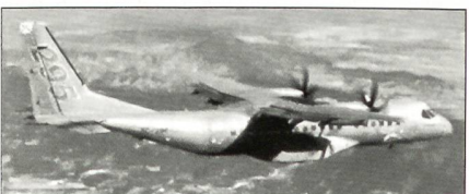
EADS CASA C-295.

Als Ergänzung zu den bereits im Dienst stehenden leichten Transportern CASA C-212 und CN-235 werden noch in diesem Jahr zwei EADS CASA C-295 beschafft.