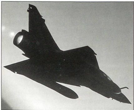
Mirage 2000D der Armée de l'Air.

Möglicherweise sollen für die indische Luftwaffe weitere 140 Kampfflugzeuge vom Typ Dassault Mirage 2000 in Lizenz hergestellt werden.