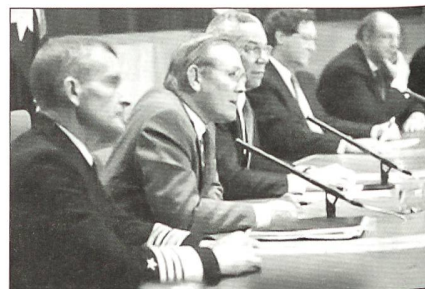
US-Verteidigungsminister Donald Rumsfeld (im Bild: Zweiter von links).

Die Verlegung der US-Kräfte kam nicht unvorbereitet. Für die Saudis war die Anwesenheit der im Land verhassten Amerikaner auf «heiligem arabischem Boden» immer ein kleineres Übel, obwohl sie deren Schutz vor dem exportierenden Fundamentalismus aus Iran und vor den Truppen Saddam Husseins in Anspruch nahmen. Für die Amerikaner kam die immer klarer